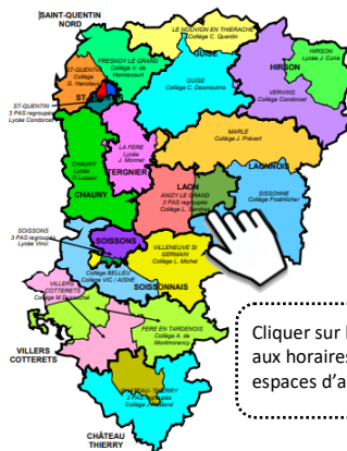
Les 24 Pôles d'Appui à la Scolarité (PAS)

Veuillez enregistrer le PDF pour la complétude numérique